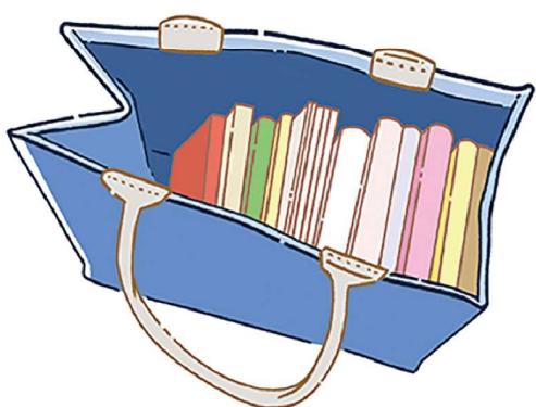
デザインが気に入ってるけど外出にはもう使えない...というバッグは収納アイテムとして活用する手も！