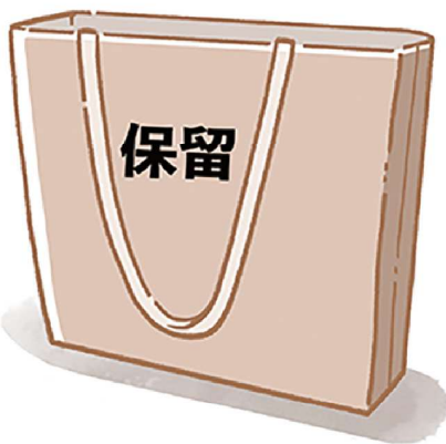
捨てられないときは、別の場所に一時保管して判断を。半年～1年放置状態なら手放しやすくなります。

が高いな」と感じたら、引き出し一つ、カゴ一つから始めてみましょう。まだ食べられるものはカゴや引き出しに戻す。これを時々、少しずつ続け、ある程度見極めが終わったら、乾物、インスタント、レトルト、お菓子という感じで分ければ、見やすくなり、ムダ買いも減ります。