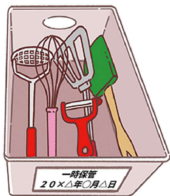
保留のモノはその入れ物に整理した日付を書くと、どれくらい置いたか確認でき、処分の目安になりますよ。

文房具もおすすめ。家の各所にペンやはさみなどが置かれていませんか？それらを集めて、すべて広げてみましょう。リビングやキッチンなど、ペンはさみはいくつ必要か、行動を思