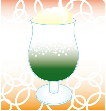
炭酸水をゆっくり注ぐと、見た目にも映える、二層のクリームソーダに！

好みのかき氷シロップでつくってみるのも良いですね！また、缶詰のサランボを添えれば、より喫茶店っぽくなりますよ！