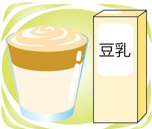
牛乳を豆乳に変えても美味しいですよ！

タルゴナとも言われる、韓国発のドリンク。味わいはコーヒー牛乳のようですが、見た目がカフェ風でおしゃれなので、気分が上がります！用意するものは、インスタントコー